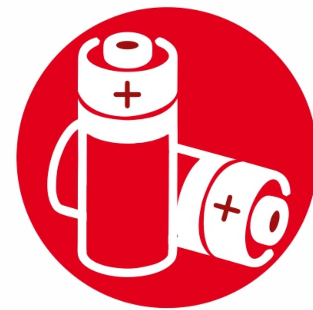
аккумуляторы и батареи